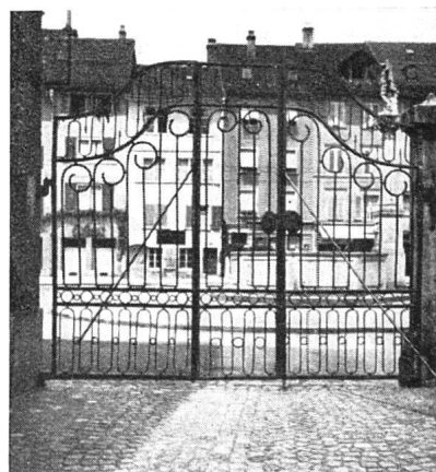
Abb. 3. Photographische Aufnahme. Die Wirkung fällt und steigt mit dem Grad des Kontrastes zwischen Stab und Hintergrund