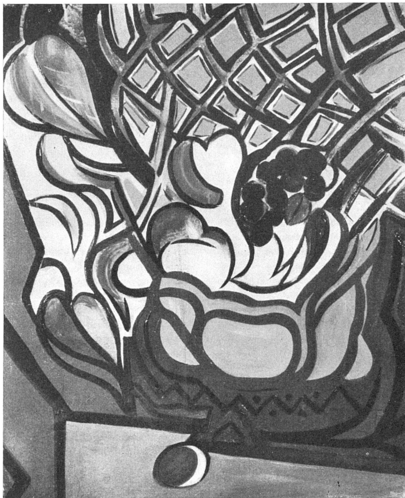
Jacinto Salvado, Stilleben , 1943

eine bescheidene Existenz ermöglichen. Von ihnen sollte die Initiative ausgehen, würdige ausländische Künstler bei uns leben und schaffen zu lassen. Um einer Invasion der Unwürdigen zu steuern, könnte der GSMBA eine Sektion ausländischer Flüchtlinge angegliedert werden, die vor ihrer Aufnahme nach Würdigkeit und Leistung gesiebt würden, wie das auch jetzt schon für die Aufnahme ordentlicher Mitglieder geschieht.