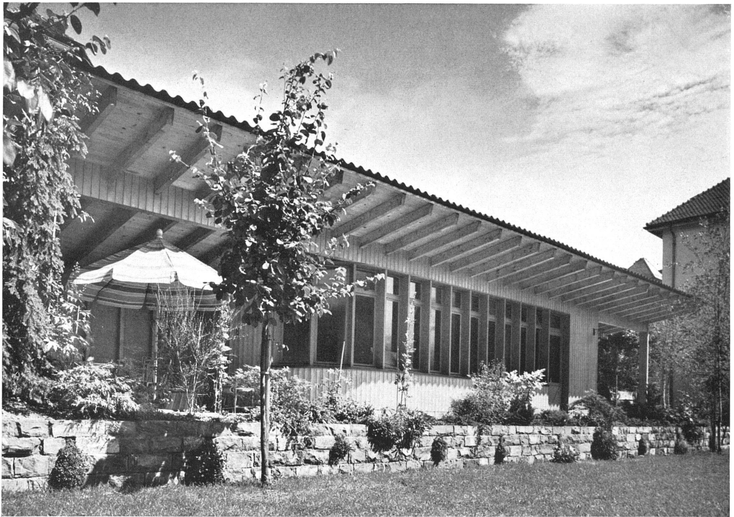
Gesamtansicht vom Garten gesehen