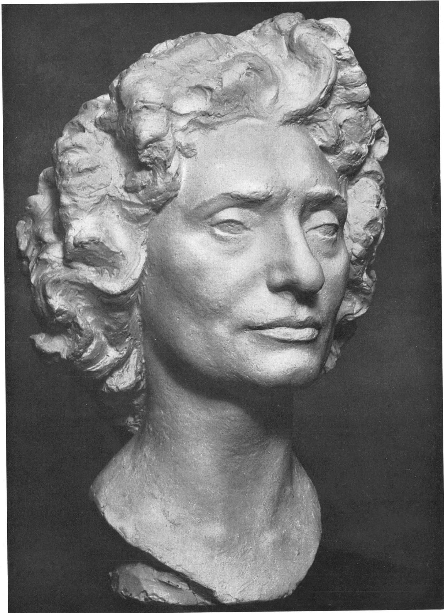
Ernst Suter Bildnis J. T.