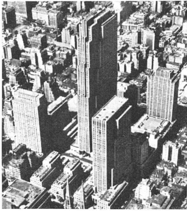
Rockefeller-Center, New York. Architekten: Reinhardt, Hoffmeister, Corbett, Harrison, MacMurray, Hood & Foulouou