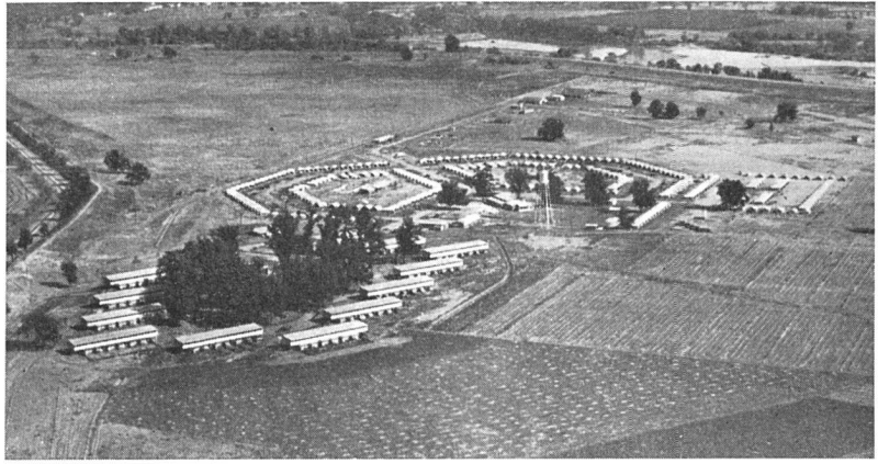
Yuba-City (Californien). Im Vordergrund ständige Wohnbauten der Farmarbeiter-Genossenschaft, im Hintergrund anschließend demontable Häuser der Saison-Arbeiter. Architekten: Cairns & De Mars

wird noch in andern Schweizer Städten gezeigt werden, und der Erfolg, den sie in Zürich hatte, rechtfertigt dies ganz besonders.