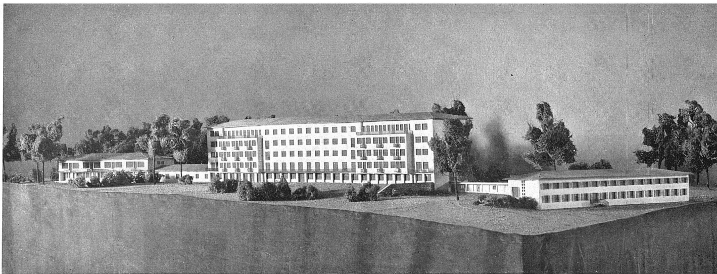
Modellansicht von Südosten