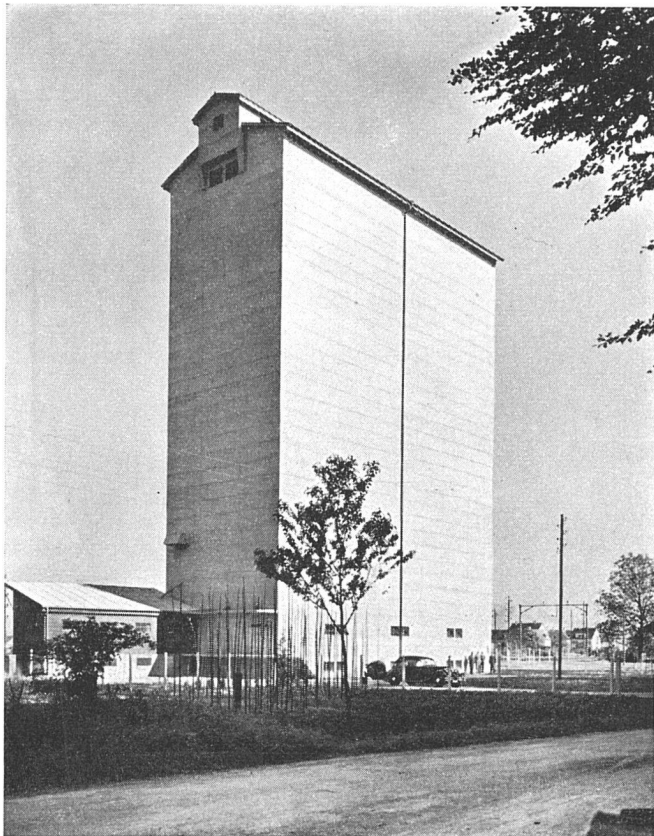
Silo Neumühle Töb