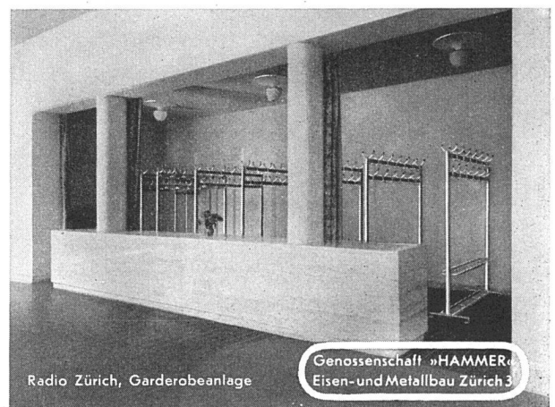
Radio Zürich, Garderobeanlage

Genossenschaft „HAMMER“ Eisen- und Metallbau, Zürich 3