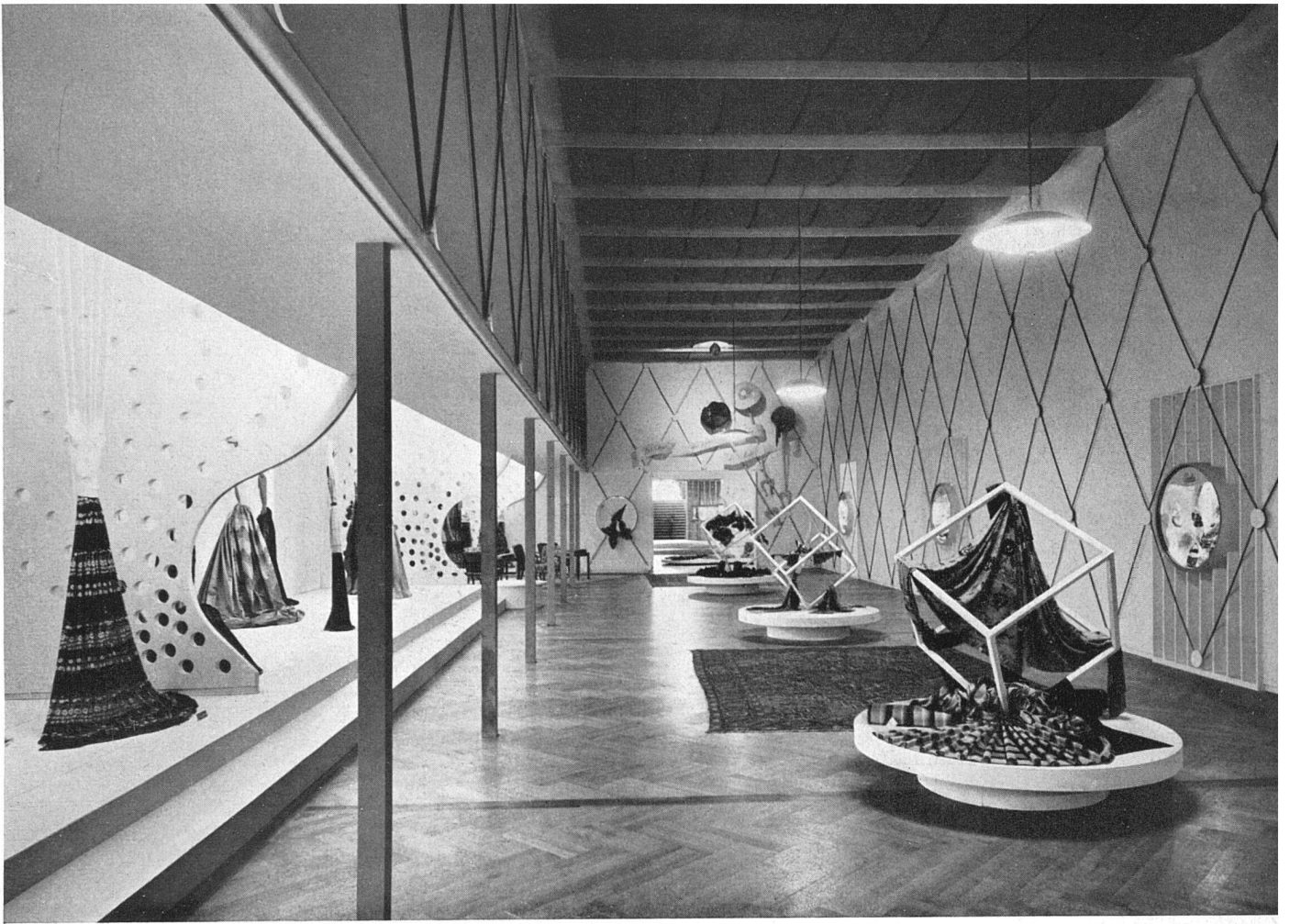
Ausstellungsraum (10) «Seide» Einzelausstellung