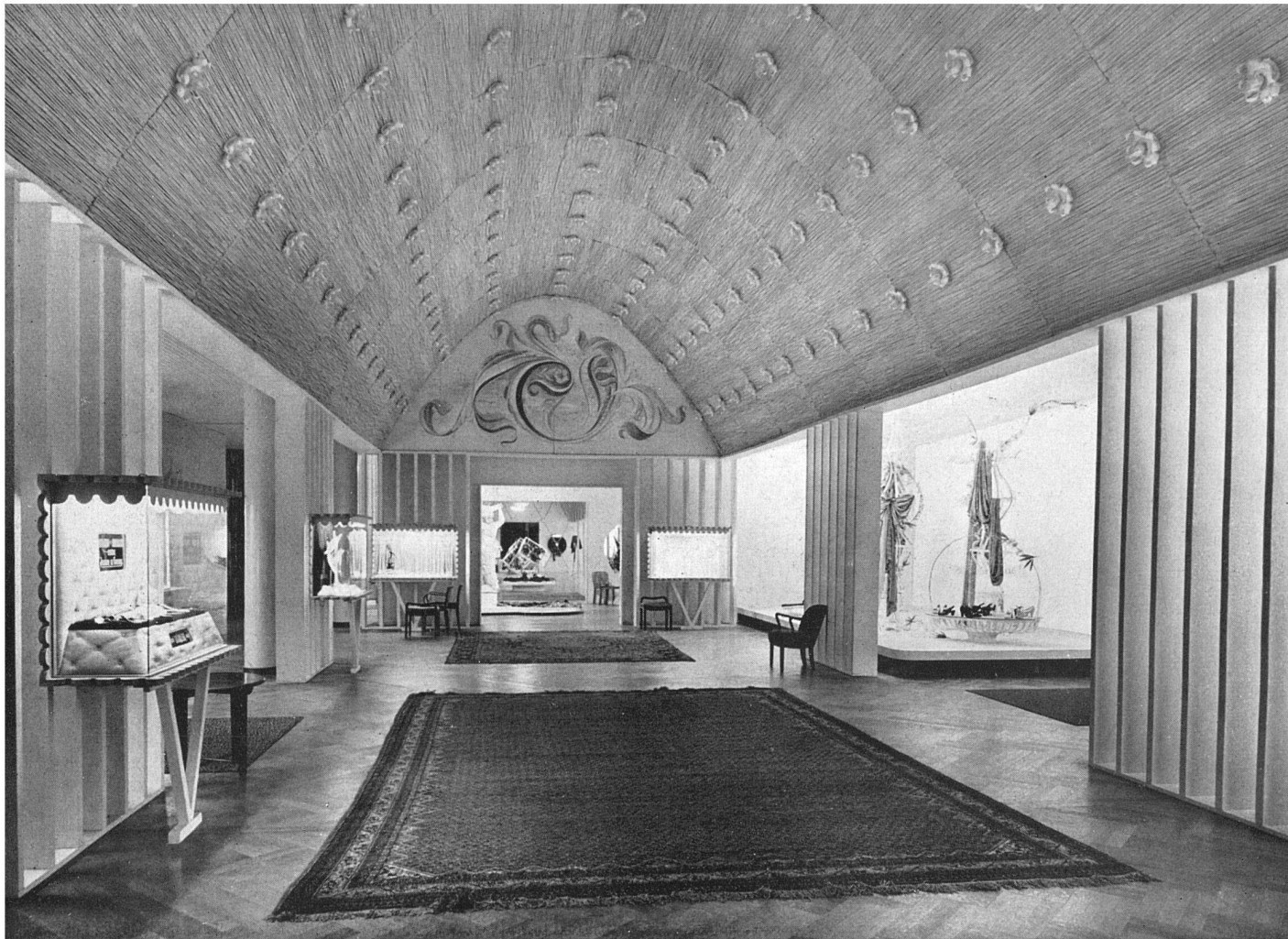
Vorraum Kongreßsaal (12) Uhren, Schmuck, Repräsentative Modevorführungen