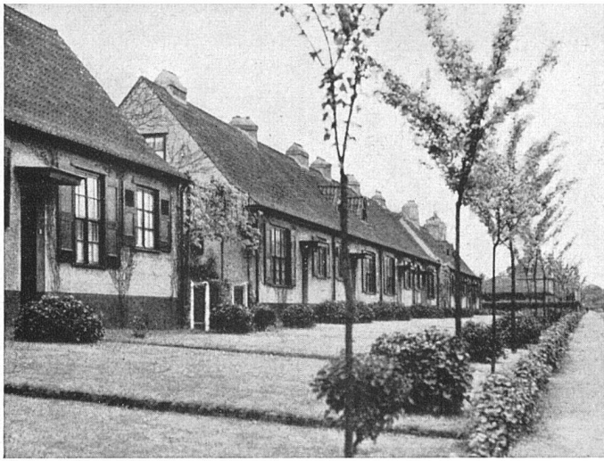
Offene Vorgärten in einer Siedlung in Brüssel

grundsätzlich niedriger, da der Garten blickmäßig schon durch die Pflanzung abgeschlossen ist, und vor allem weniger aufwendig als früher, bevorzugen gehobelte Vierkantlatten oder einfache geschmiedete Vierkantstäbe mit geringster Unterteilung durch Pfeiler und Pfosten. Das verzinkte Drahtgeflecht empfehlen wir dann, wenn es für das Auge im Grün der dahinter gepflanzten Hecke oder im Laubwerk üppig wachsender Schlingpflanzen (Efeu, Geißblatt, Wilder Wein u. a. m.) verschwindet. Hinter weitmaschigem Drahtgeflecht entwickeln sich Heckengehölze, da beidseitig voll belichtet, gut und gleichmäßig, vor Mauern hingegen, wo man sie leider allzu oft sieht und wo sie an und für sich vollkommen sinnlos sind, werden sie einseitig verkümmern.