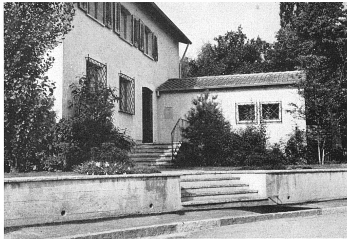
Offener Vorgarten mit niederer Mauer