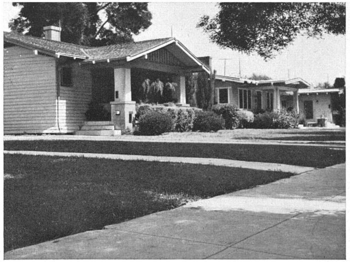
Zaunlose Gärten in nordamerikanischem Villenviertel

Wie wir für den Wohngarten in der Stadt grundsätzlich einen dichten Abschluß nach außen verlangen, so verneinen wir ihn für den Vorgarten . Der Raum zwischen Bauflucht und Straßentrucht, dieser Streifen von ungefähr 3–6 m Breite, ist nicht zu einem persönlichen Gärtchen auszubilden, in dem man aus naheliegenden Gründen doch nicht wohnen kann, sondern er ist nach der Straße zu öffnen, er gehört visuell zur Straße und damit zur Allgemeinheit. Wir denken dabei an Wohnstraßen, auch an Straßenzüge in Industriebezirken, die nach städtebaulichen Überlegungen bisweilen breit geplant aber vorerst schmal ausgebaut werden. Bei geschlossener Bauweise, beim Zeilenbau, sind die Vorgartenstreifen ohne jegliche Unterteilung einheitlich zu behandeln, und zwar bevorzugen wir bei entsprechender Tiefe die schlichte Rasenfläche, die eben ist oder leicht gegen die Häuser ansteigt, zu denen zwanglos Stauden, Sträucher und Schlingpflanzen überleiten. Die einzige Begrenzung straßenwärts bildet dann eine Kante aus Naturstein, die um wenige Zentimeter höher liegt als der Gehweg. Wo man glaubt, damit kein Genüge zu finden, begrenzt man den Rasen durch ein 40 cm hohes Mauerchen oder eine niedrige Hecke, für die sich zum Beispiel Berberitzen gut eignen. Es ist selbstverständlich, daß bei ganz besonders schmalen Vorgartenstreifen an Stelle des Rasens eine einheitliche niedrige Strauchpflanzung tritt. Bei offener Bauweise und üblicher Vorgartentiefe wird der Straßenraum in der glei-