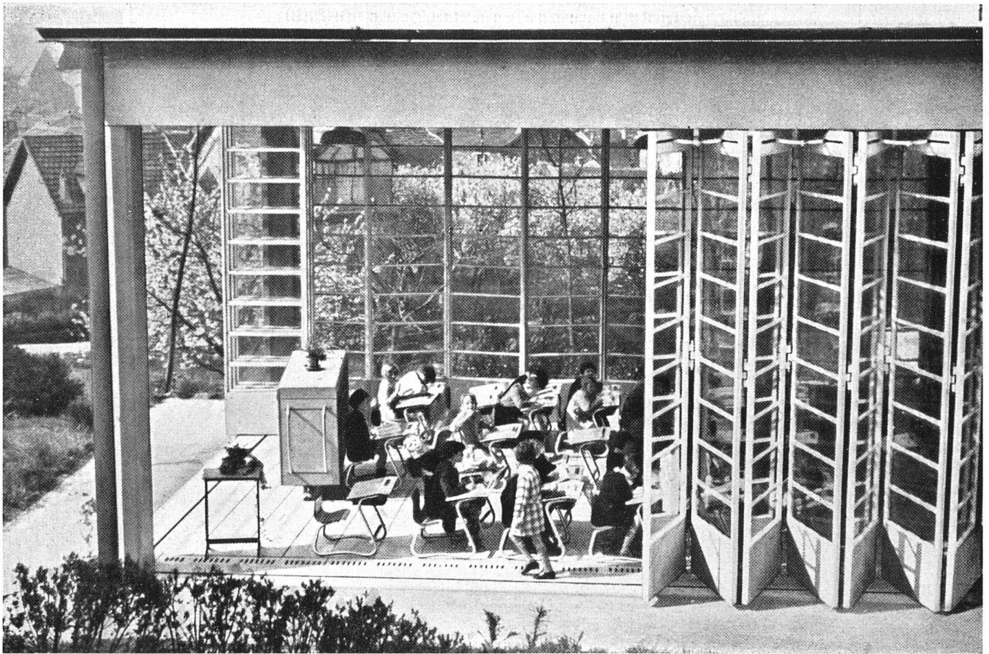
Pavillon de classe ouvert côté est et sud