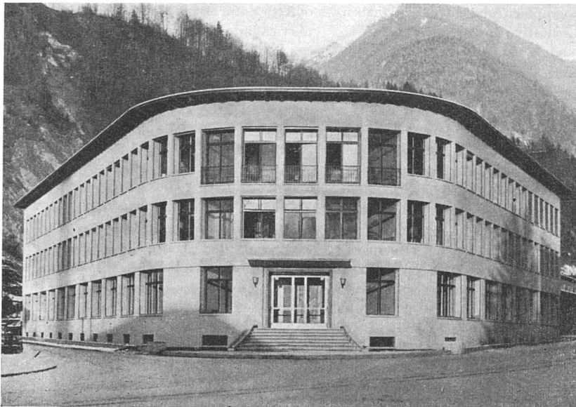
Neubau der „Therma“ in Schwanden (Gem. Ausf.)