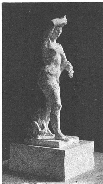
Entwurf von Charles Otto Bänninger