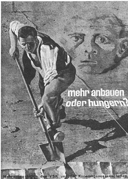
Plakat der Mehranbauaktion des VSK und der Konsumgenossenschaften. Entwurf Hans Erni SWB, Luzern.

rein Handwerklichen, wozu er dem Untertitel nach natürlich berechtigt ist. Trotzdem müsste gerade der werdende Tischler dafür dankbar sein, wenn man ihm zeigen würde, wie sich der Standpunkt der Qualität auch in der Maschinenarbeit aufrecht erhalten lässt: hier dürfte sogar eines der allerwichtigsten Probleme liegen. Man kann dem Verfasser zustimmen, dass eine rein handwerkliche Lehre für die Erziehung des Möbelschreiners das Wünschenwerteste ist: im praktischen Beruf wird er trotzdem nicht ohne Maschine auskommen, und so sollte man nicht so tun, als ob sie etwas Illegitimes wäre. Was in diesem Buche steht, ist sehr beherzigenswert, darin aber, dass es nirgends über die Grenze des mittelalterlichen, streng Handwerklichen hinausgeht, liegt ein gewisses Ausweichen vor der Gegenwart und eine unnötige Beschränkung.