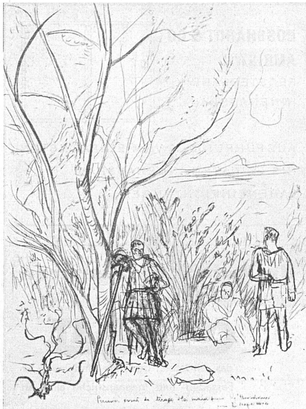
Lithographie von Ernst Morgenthaler aus «Virgile, les Bucoliques». Subskription bis Oktober bei Louis Grosclaude, Splügenstr. 2, Zürich, siehe «Werk» Nr. 4 1942, S. XXIV.