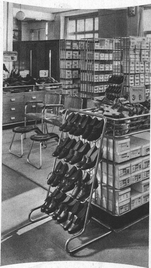
Schuhabteilung Globus, Zürich

Ladeneinrichtungen aus verchromtem Stahlrohr