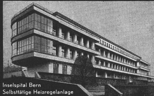
Inselspital Bern Selbsttätige Heizregelanlage System Landis & Gyr

dosiert die Heizleistung selbsttätig nach der Witterung. Sie passt sich den Erfordernissen jeden Heizbetriebs an und gestattet sparsamste Brennstoff-Verwendung.