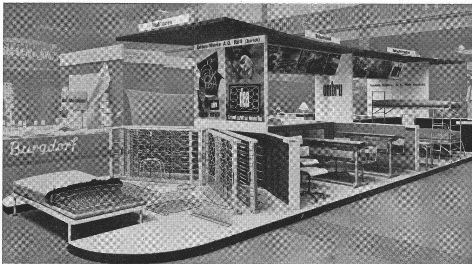
Gute Stände der 25. Mustermesse Basel 1941

Stand der Embru-Werke, Rüti (Zürich), ausgeführt von Pierre Gauchat, Grafiker SWB, Zürich