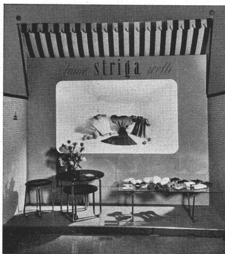
Stand der Firma «Striga-Wolle», ausgeführt von Donald Brun, Grafiker SWB, Basel. Typus des geschlossenen Standes

Die Embru-Werke sind ein bemerkenswertes Beispiel und Vorbild für die einheitliche Gestaltung aller Werbemittel durch einen Grafiker. Die Grundfarbe der Etikette «embru» auf Plakat und Anhängadresse ist Ponceau-Rot.