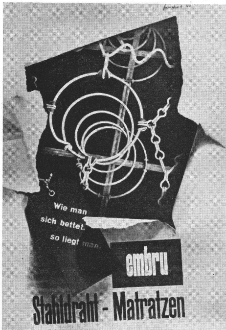
Stand der Embru-Werke, Rüti (Zürich), ausgeführt von Pierre Gauchat, Grafiker SWB, Zürich