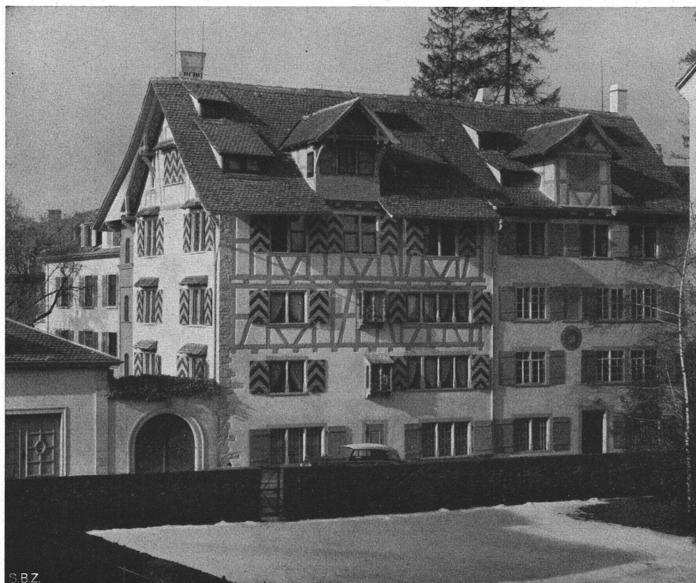
oben: Ecke Bärengasse- Talacker, im Vordergrund das Haus «Zur Arch». Ein Rest Alt-Zürich mitten in der Großstadt