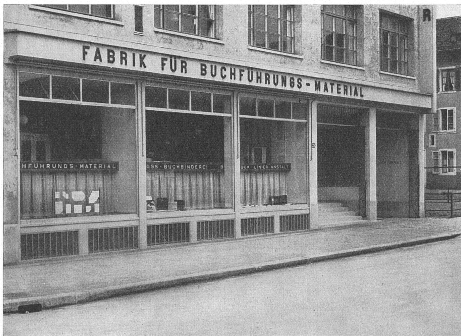
Geschäftshaus Paul Carpentier Söhne, Zürich. Architekten: Debrunner & Blankart, Zürich

Ausschliessliche Spezialfabrik für Ventilatorenbau und luftechnische Anlagen