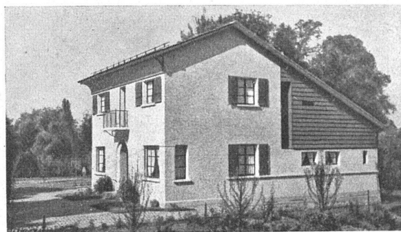
Première catégorie de villas (jusqu'à 40 000 fr.), 1 er diplôme Marcel Bonnard, architecte FAS