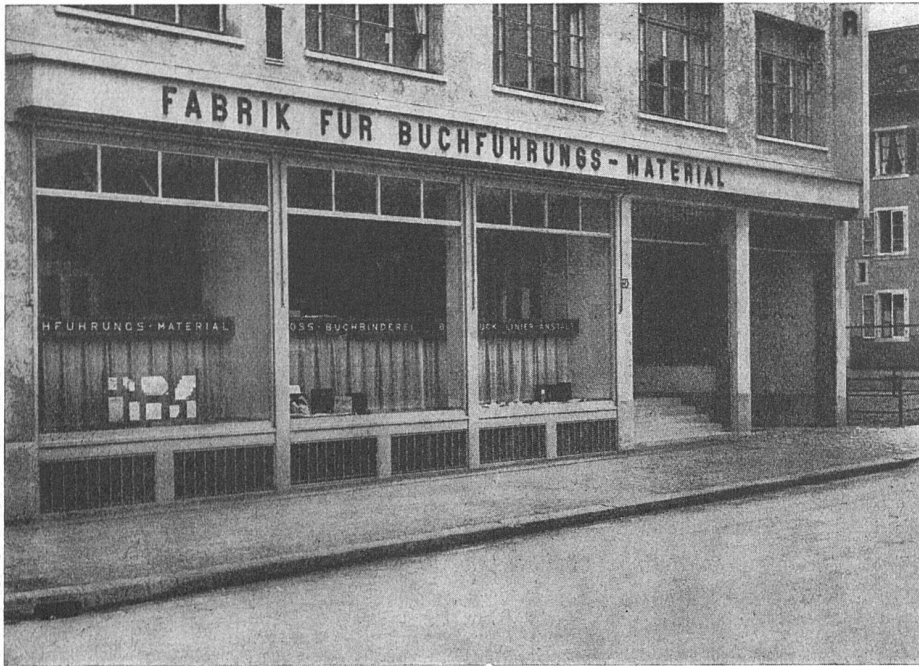
Geschäftshaus Paul Carpentier Söhne, Zürich. Architekten: Debrunner & Blankart, Zürich

Schaufensteranlagen in Eisen, Bronze und Anticorodal. Scherengitter. Sonnenstorenanlagen