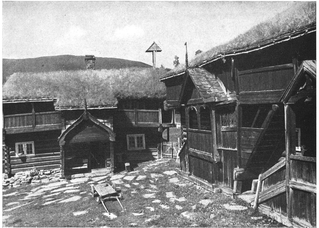
Hof Bjølsstad in Hedalen