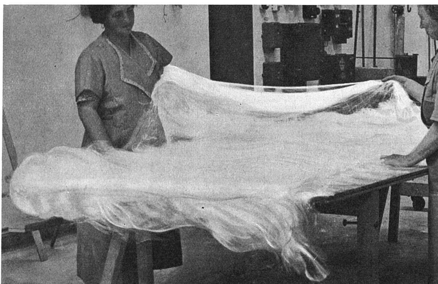
Stränge von Glasseide werden zu Matten zusammengelegt

der Büroräume des Neubaues der Schweiz. Rentenanstalt in Zürich und die Hörsäle und Laboratorien des Neubaues des Kantonalen Technikums in Winterthur, die beide mit Strahlungsheizung versehen sind, mit Glasseide isoliert.