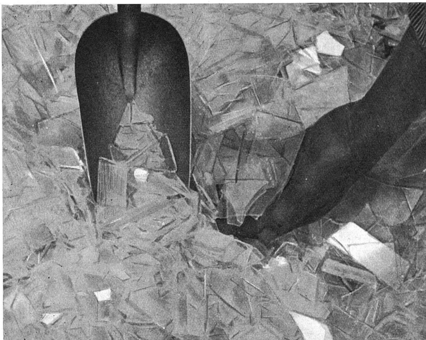
Glasscherben — das Ausgangsmaterial für die Herstellung von Glasseide

Seit einigen Jahren wird Glasseide erfreulicherweise auch in der Schweiz hergestellt. Die Aufnahmen stammen aus der Glasspinnerei Cavin & Co., Zürich, in Adliswil