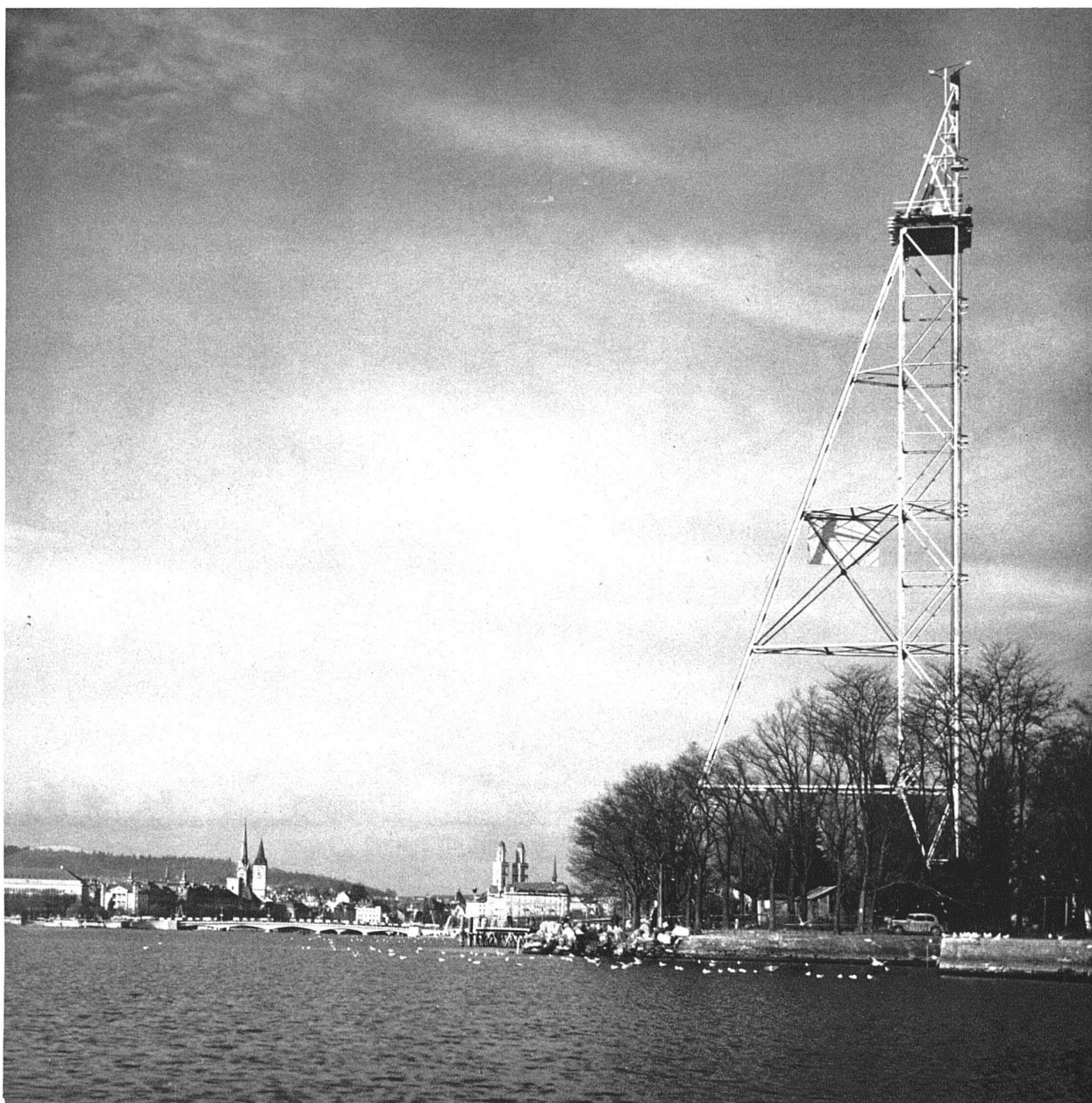
Seilschwebbahn über den Zürichsee. Der Turm am rechten Ufer im Bau. Entwurf: Ing. R. Becker (Buss A. G., Basel) und J. Schütz, Architekt BSA, Zürich