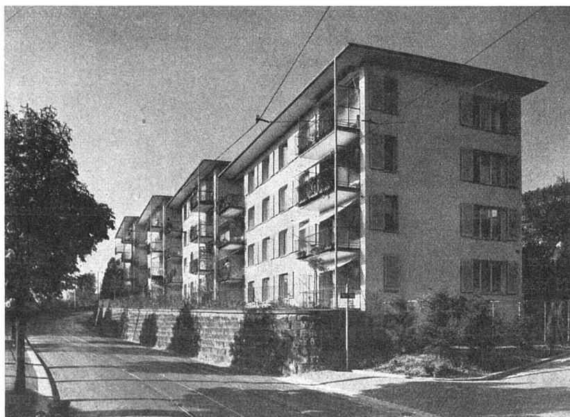
Wohnkolonie Oeristeig, Zürich Allgemeine Baugenossenschaft Zürich Arch.: Kellermüller & Hofmann, Zürich

Flachdächer, ca. 1500 m 2 , mit teerfreier Dachpappe «Turicum» der Asphalt- Emulsion A.-G., Zürich, ausgeführt durch die Genossenschaft für Speng- ler-, Installations- und Dachdecker- arbeit, Zürich 4