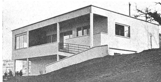
Catégorie B: Villa chemin du Nant d'argent 3 e prix. «Atelier d'architectes», Genève