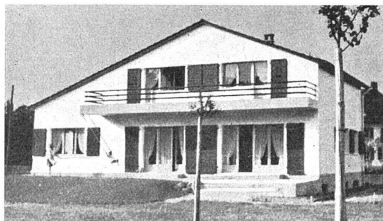
Catégorie B: Wohnhäuser unter 40 000 Fr. Baukosten 2 e prix ex aequo. Angle Grange-Falquet-Sismondi «Atelier d'Architectes», Genève