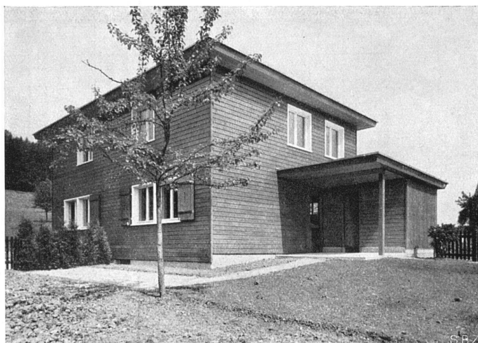
Südostecke, rechts Schopf und Sitzplatz Zweifamilienhaus in Holzbau, Typ B der Grundrisse Seite 56

Siedlungen aus Holzhäusern Musterhaus der Holzhausssiedlung Bruggwaldstrasse, St. Gallen Erbaut April/Mai 1937