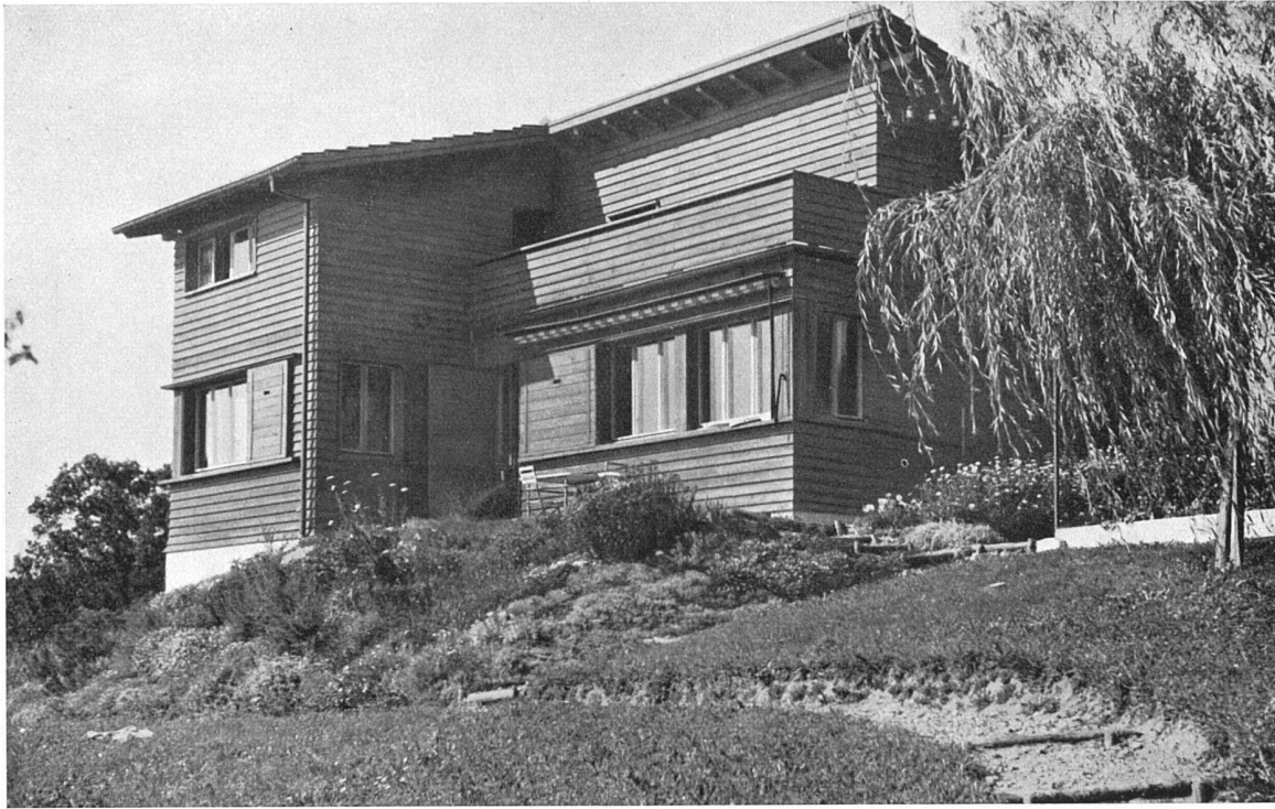
Ansicht aus Süden