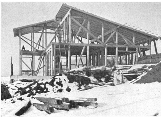
Der Rohbau von Osten. Bauzeit: Februar bis April 1934

Alle Wohnräume im Erdgeschoss, im Untergeschoss Heizung, Keller und Garage. Hölzerner Ständerbau mit beidseitiger Schalung und Dachpappenisolierung, Wohn- und Nebenzimmer mit glattem Oregon-Fichtentäfer. Baukosten ohne Umgebungsarbeiten, aber einschliesslich der zahlreichen eingebauten Möbel und mit Architektenhonorar Fr. 29 000. Kubikmeterpreis Fr. 65.90.