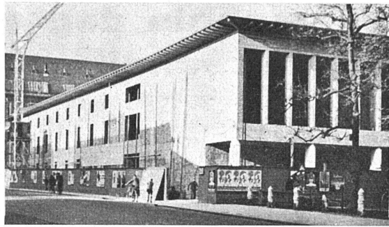
Basler Bauchronik (vergl. den Text auf Seite XIV des Juliheftes)

In diesem Bändchen der Sammlung Götschen gibt der Erbauer des Wiener Stadions sowie der Hochbauten der Nürnberger Stadien usw. eine zusammenfassende Darstellung von Sportbauten, Amphitheatern und Bädern von der Antike bis zur Gegenwart, nebst allen wünschbaren Massangaben im ganzen und einzelnen: ein nützliches kleines Handbuch für Behörden, Sportvereine und Architekten.