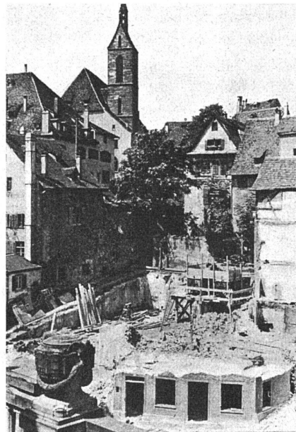
Abbruch am Fischmarkt

Das neue Kollegiengebäude der Universität am Petersplatz, an Stelle des abgebrochenen Zeughauses Architekt: Dr. Roland Rohn BSA, Zürich