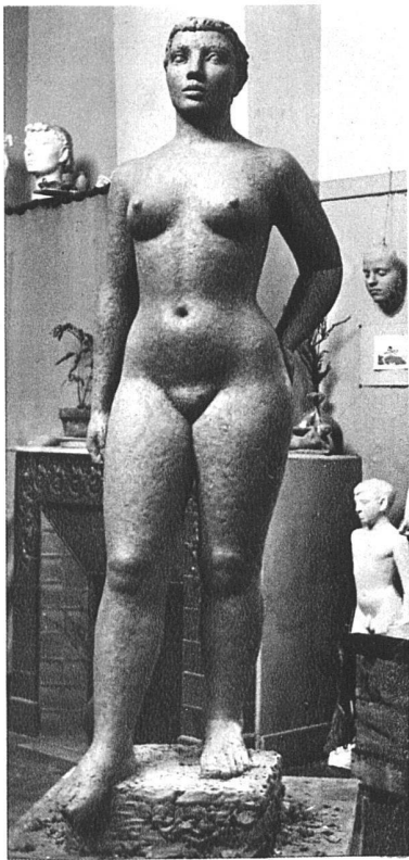
«Stehende» in ganzer Figur