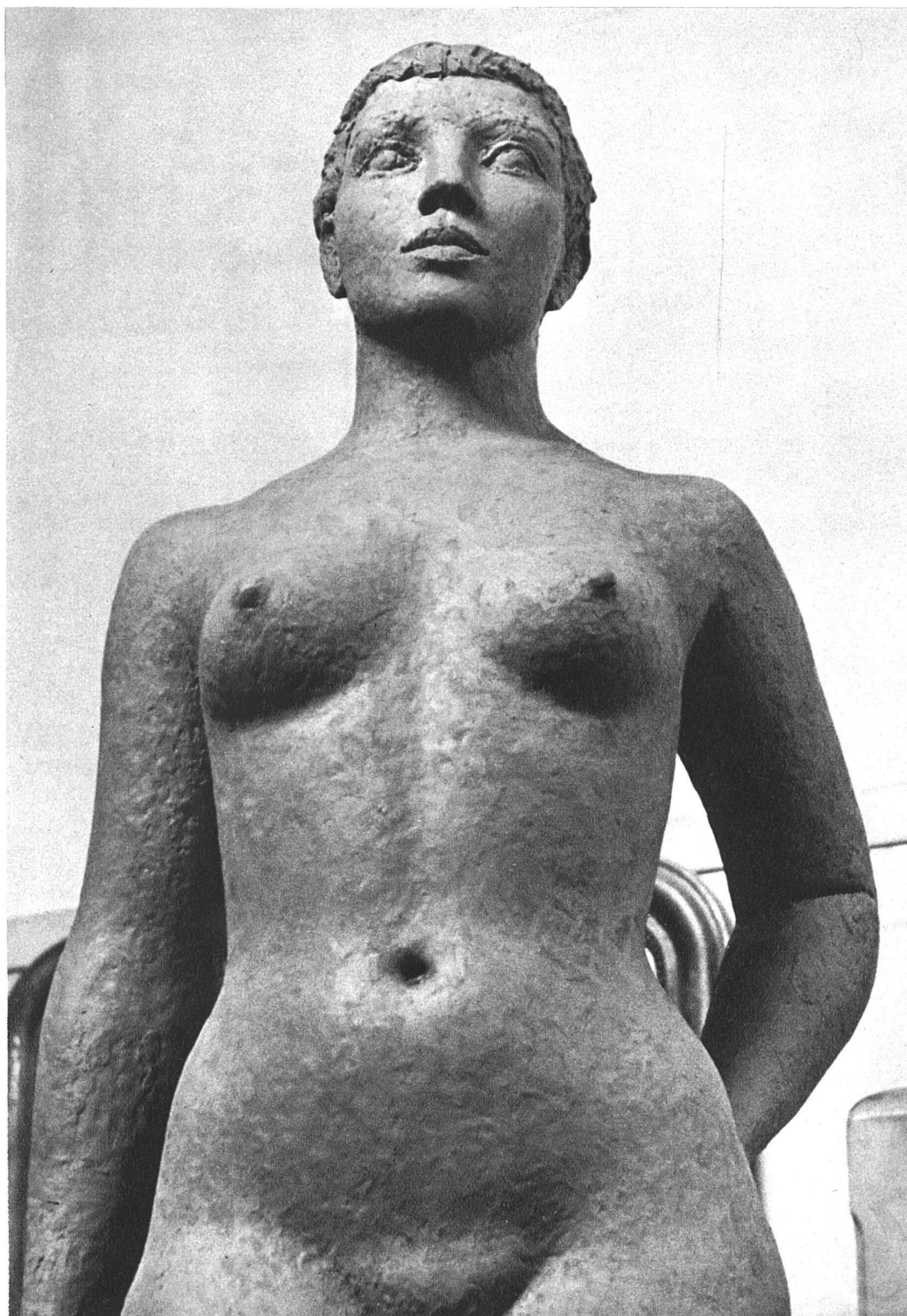
«Stehende», Detail nach dem Lehmmodell, lebensgross, 1937

einer sorgfältigen Pflege, und damit stellen sich für Luzern wieder besondere Aufgaben. Die letzten Jahre zeigen bereits erfreuliche Ansätze zu einer Beruhigung des Stadtbildes. Auf genossenschaftlicher Basis sind einige recht geglückte Bebauungen entstanden, oder es ist, wo nicht freiwillige Uebereinkunft oder behördlicher Zwang