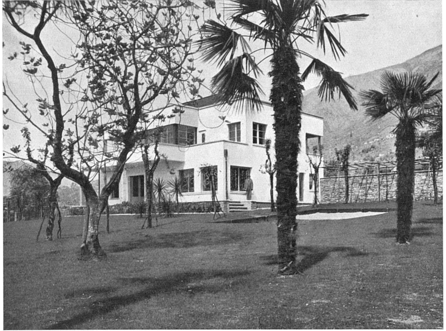
Ansicht aus Südosten

Ferienhaus W. B. in Locarno-Minusio E. Bechstein, Architekt BSA, Burgdorf