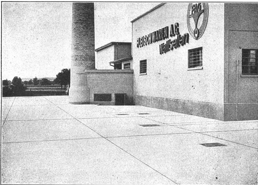
Ausführung von Kieserling Spezialbeton «Durocret» Duratexbeton Egypto farbig