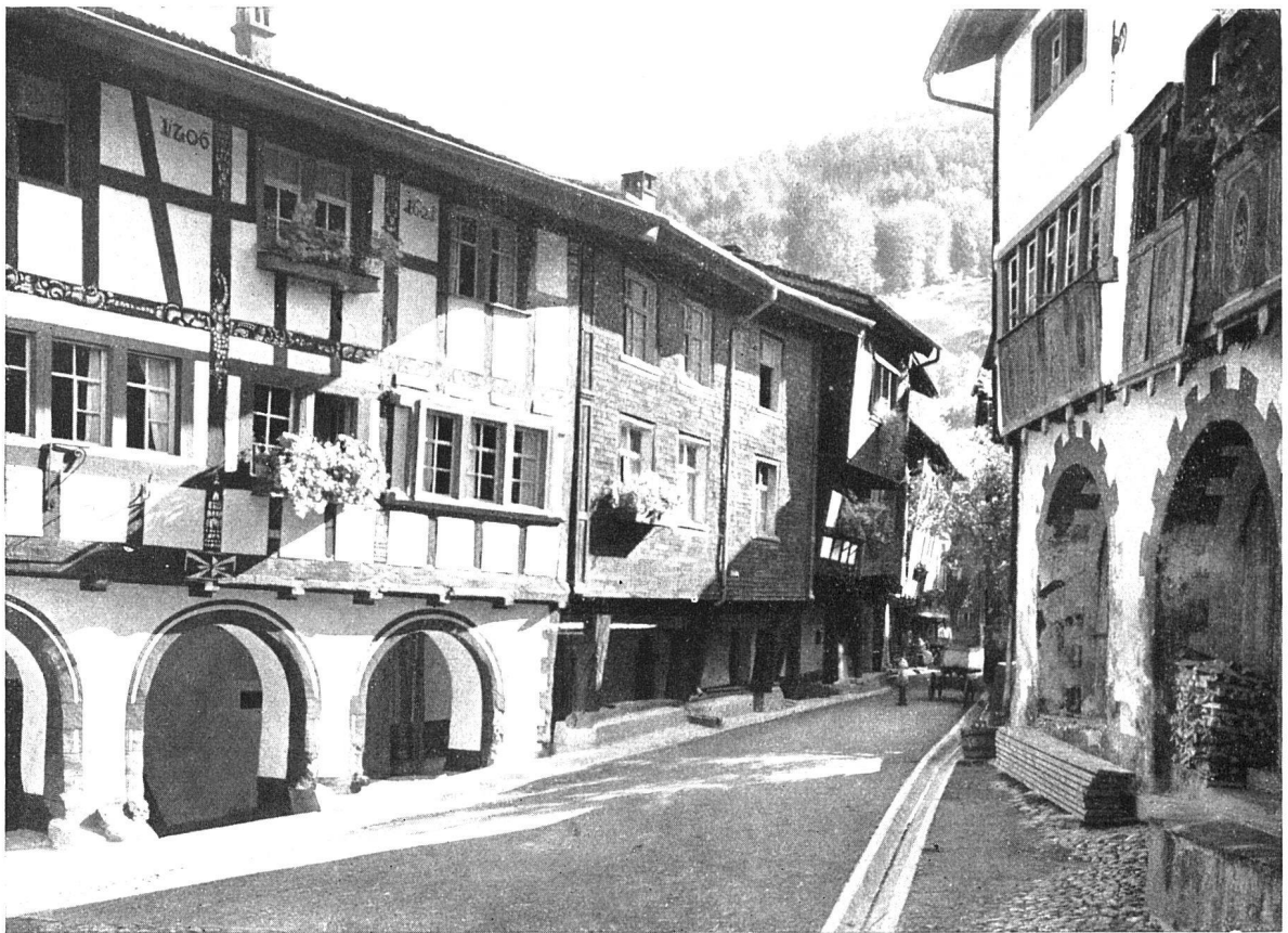
Werdenberg, Hauptstrasse. In dieser Art hat man sich die Strassen auch der grössten Städte noch des XIV. Jahrhunderts vorzustellen

«Das Bürgerhaus in der Schweiz», Band XXIX, Kanton St. Gallen, II. Teil Seite 381 oben: Stadt und Schloss Rapperswil am Zürichsee, gegründet Anfang des XIII. Jahrhunderts unten: Städtchen und Schloss Werdenberg im St. Galler Rheintal