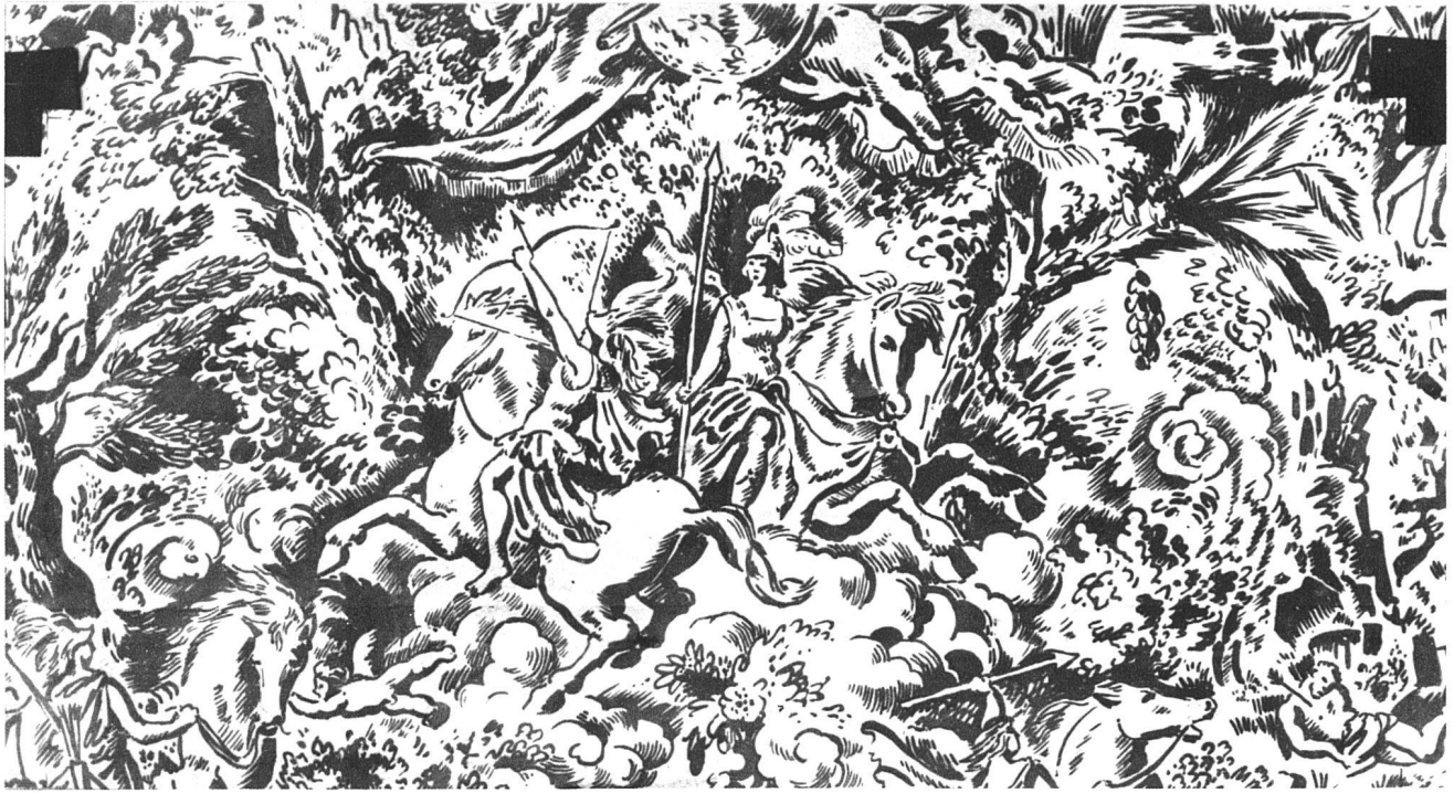
«Le Combat des Amazones», dessin de J.-L. Gampert

Papiers peints genevois de H. Grandchamp & Co., Genève