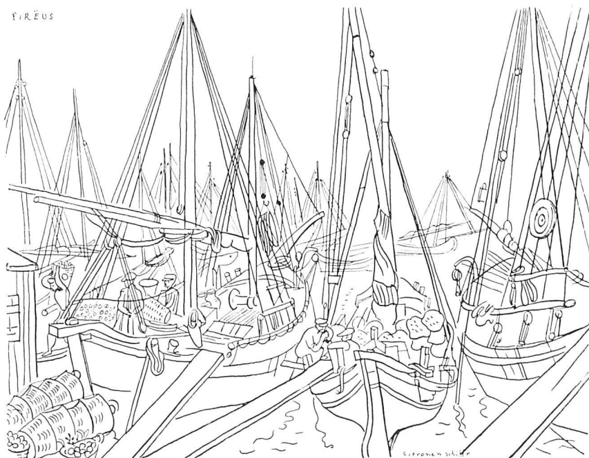
Piräus, der Hafen von Athen