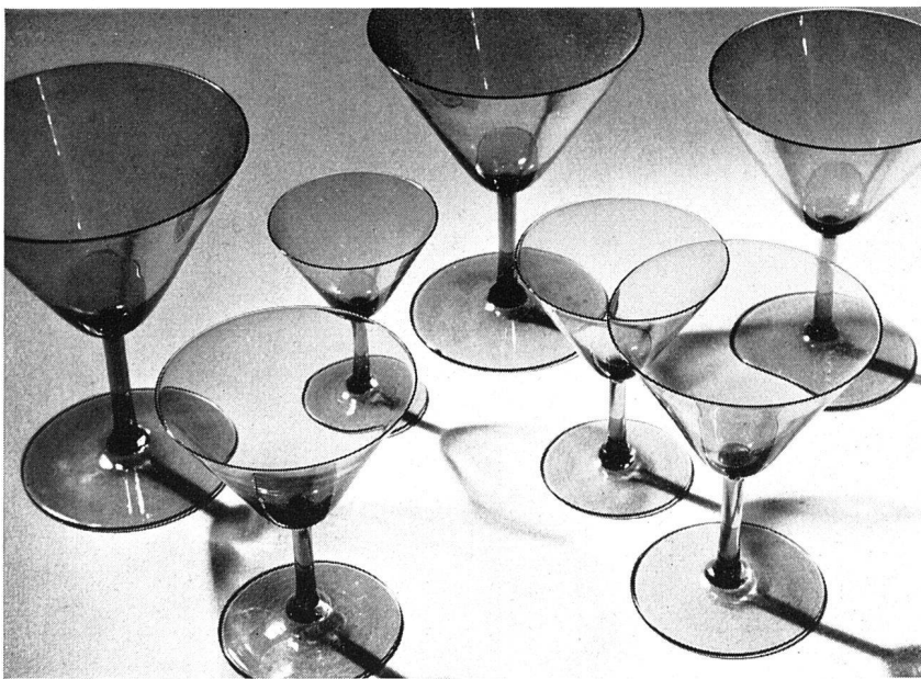
Glasservice von Orrefors-Glashütte