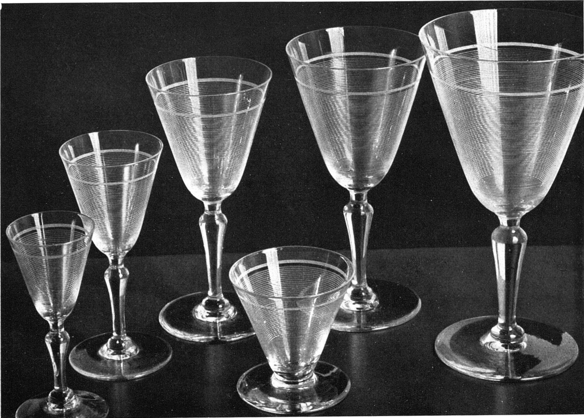
Glasservice von Orrefors-Glashütte