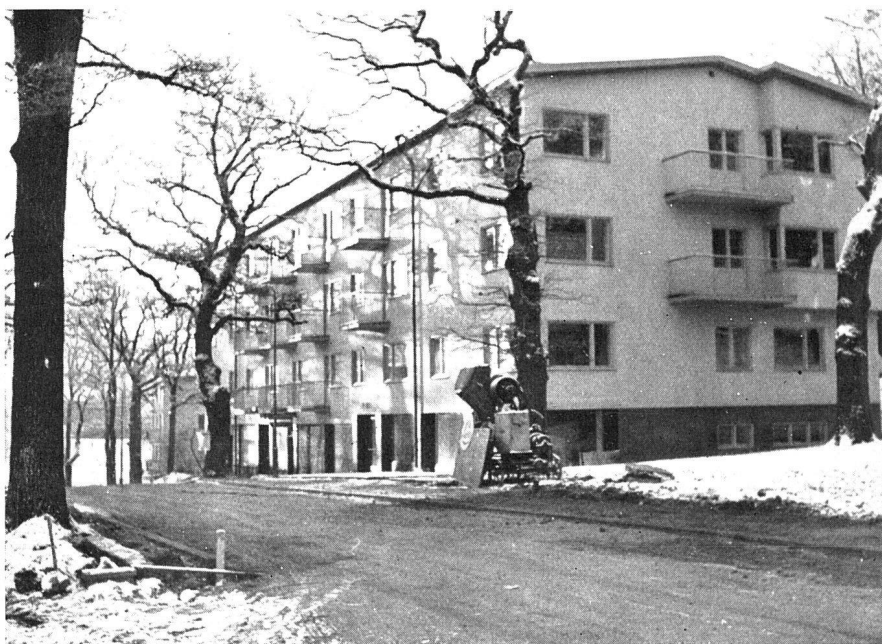
Miethaus der Siedlung Ekhagen Architekt Björn Hedvall (hiesu Grundriss auf Seite 9)