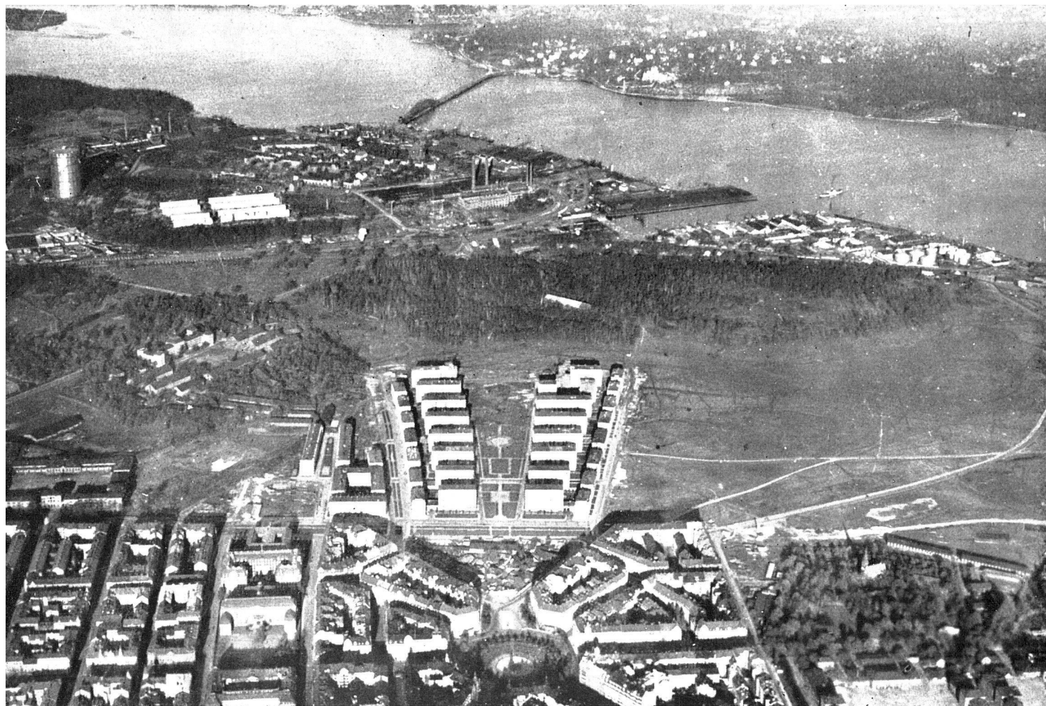
Wohnsiedlung Ladugårdsgärdet im Norden von Stockholm. Vordergrund alter Siedlungsteil von 1880–1925 gebaut. Mittlerer Siedlungsteil 1931–1935 in 6–8 Stockwerken erbaut