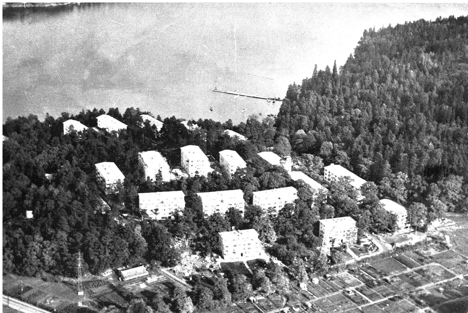
Wohnsiedlung Ekshagen bei Stockholm, erbaut 1935