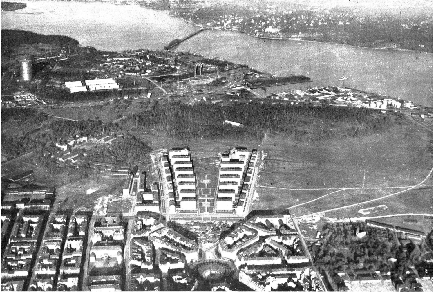
Wohnsiedlung Ladugårdsgärdet im Norden von Stockholm. Vordergrund alter Siedlungsteil von 1880–1925 gebaut. Mittlerer Siedlungsteil 1931–1935 in 6–8 Stockwerken erbaut