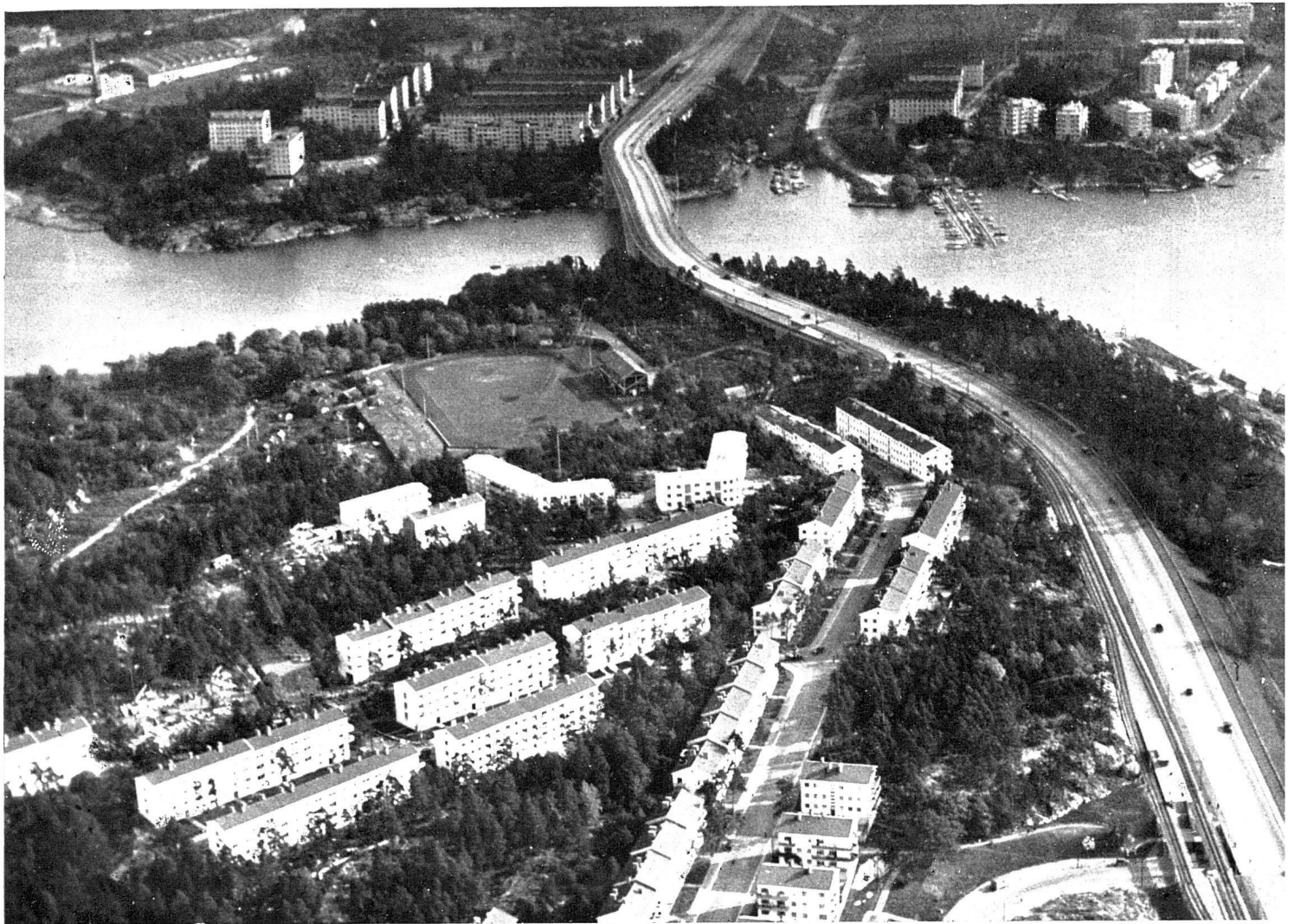
Siedlungen im Westen von Stockholm. Im Vordergrund Traneberg, 1935/36 gebaut. Grundstücke mit Nutzungsrecht von der Gemeinde vermietet, nicht verkauft; im Hintergrund Fredhäll, 1930—1936 gebaut. Schnellbahn verbindet die Siedlung mit der Stadt. Der Wald wird in den meisten Vorortssiedlungen bis dicht an die Häuser hin stehengelassen, so dass sie von der Strasse aus kaum sichtbar sind. Neben den unzähligen Wochenendhäuschen in Holzkonstruktion trifft man in der Umgebung Stockholms sehr oft vier- bis achtstöckige Wohnblöcke. Die Fundierungsarbeiten, d. h. das Sprengen des Granits ist sehr kostspielig. Der Granitgrund bildet aber andererseits eine solide Baubasis. Rechts im Bild: neuerdings fertiggestellter überhöhter Strassen- und Eisenbahndamm mit Brücke.

fügung, raffiniert eingerichtet mit Kochherd samt Backofen, einem von einer Zentrale mit Kühlsole versehenen Eisschrank, dem mit rostfreiem Stahl ausgekleideten Abwaschtisch, mit Schränken und Schäften.