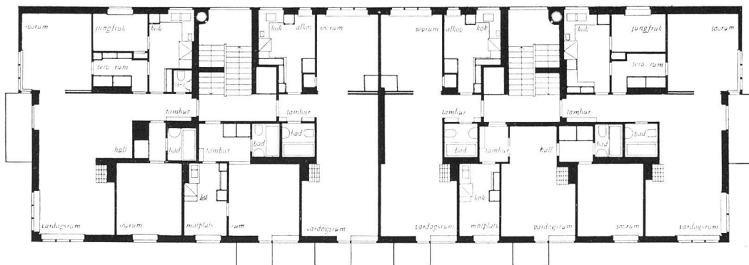
Einzelheiten dieser Siedlung vergl. «Werk» 1933, Heft 5, Seite 140