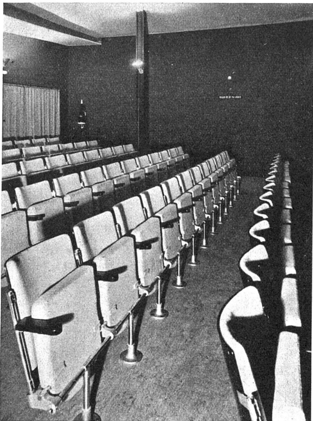
Bestuhlung des Kinos im Schweizer Pavillon an der Internationalen Ausstellung Paris 1937

Entwurf und Ausführung durch die A.-G. Möbelfabrik Horgen-Glarus in Horgen