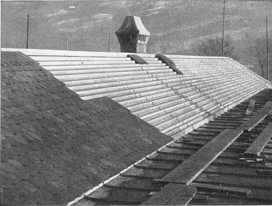
Altersasyl in Näfels Eternitrippen-Unterdach Architekt H. Lampe, Näfels