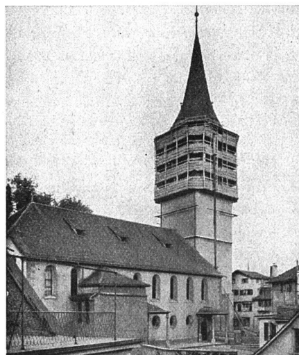
rechts: Kirche St. Peter Zürich

Vertreter in allen grösseren Kantonen • Mietweise Erstellung für Neu- und Umbauten durch