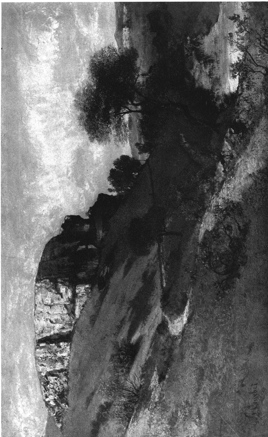
Gustave Courbet. La vallée de la Loue prise de la Roche du Mont 1849 148 × 92 cm.