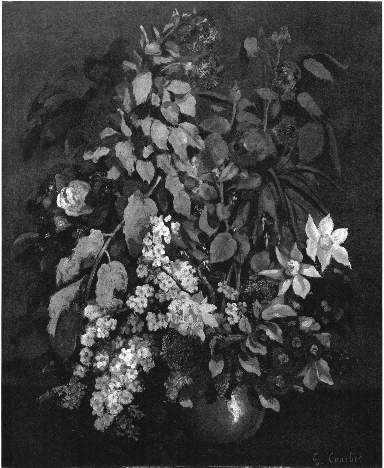
Gustave Courbet. Le bouquet 1863 54 × 65 cm.