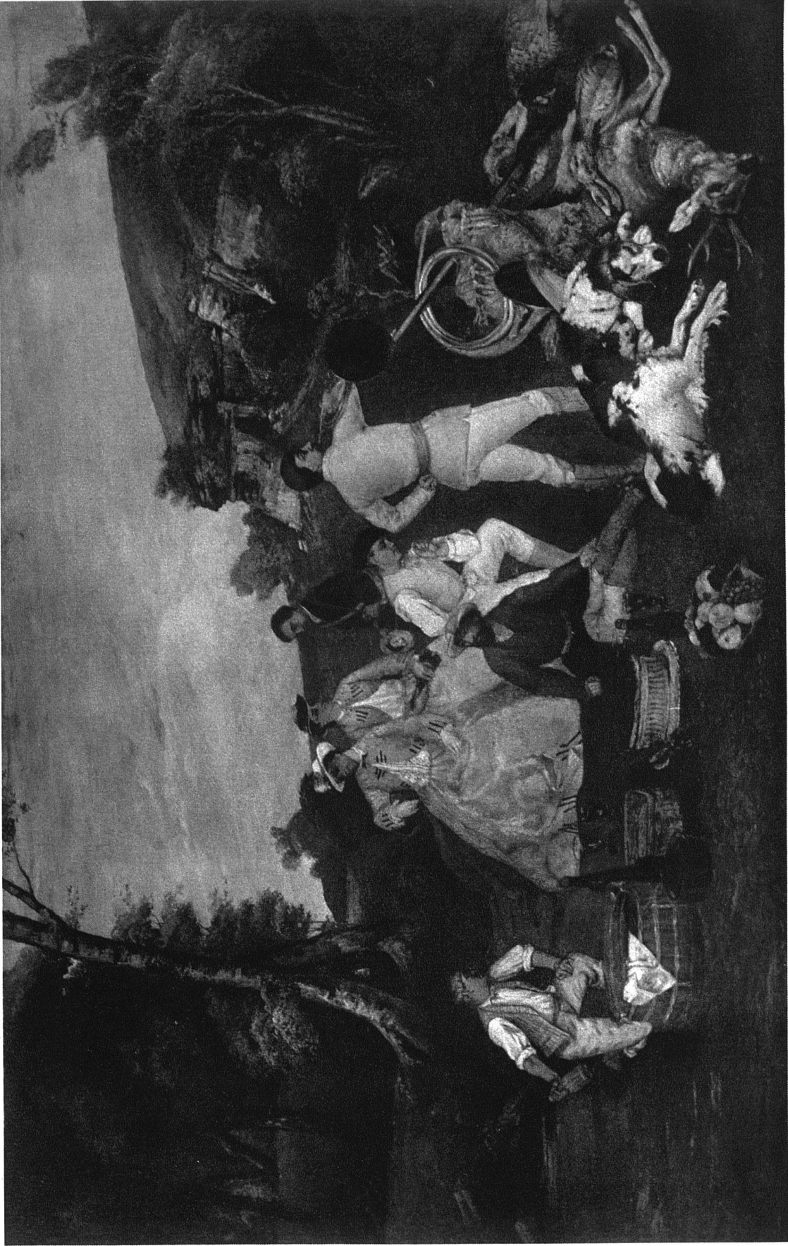
Gustave Courbet. L'hallali du chevreuil ou Le déjeuner de chasse 1858 325 × 207 cm.