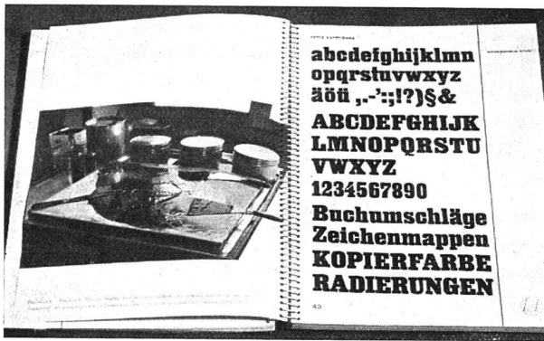
Ein vorbildlich ausgestatteter Schriftenkatalog: das neue Schriftenbuch der Firma Gebrüder Fretz A. G., Zürich