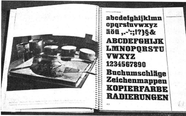
Ein vorbildlich ausgestatteter Schriftenkatalog: das neue Schriftenbuch der Firma Gebrüder Fretz A. G., Zürich