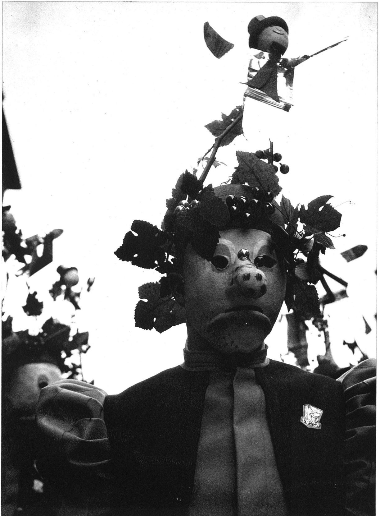
«Sauce fédérale» 1936 (geht auf den aus Wein aller Landesgegenden gemischten Einheitsweisswein). Tambour als «Bundesdubel». Larve violett und grün, auf dem Kopf künstliches Reblaub mit Beeren und Spatzenschreck aus Stanniol, Kostüm herbstbrauner Filz mit schwarzem Kittel. Entwurf K. Hindenlang, Basel