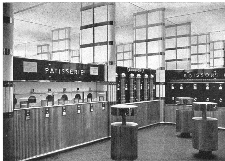
Buffetraum, hinterer Teil Tischchen aus Aluminium und Mattglas