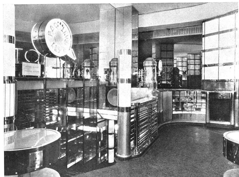
Bar. Verre opaline blanc et noir, aluminium dépoli, pavé mosaïque vert