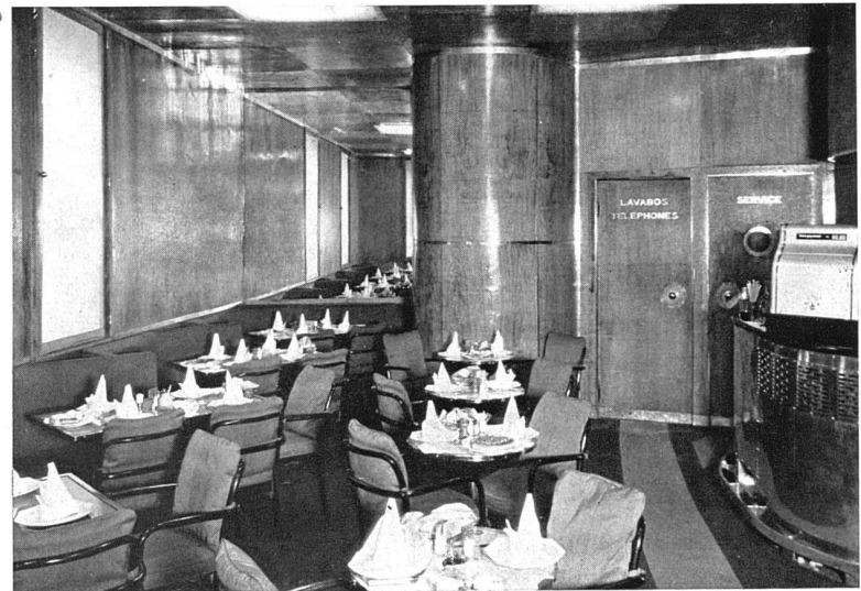
La salle à manger. Les parois sont revêtus de bois de chêne nature vernissé, couverture des chaises en tissu de cheveux chevalins vert, le sol est revêtu de velours brun-clair