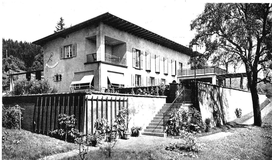
Haus Müller-Mettler in Risch am Zugersee Ernst Rentsch, Arch. BSA Basel