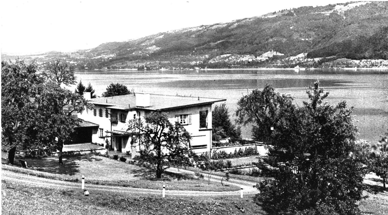
Ansicht aus Südwesten Blick auf den Zugersee