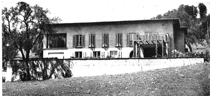
Gartenterrasse an der Ostseite