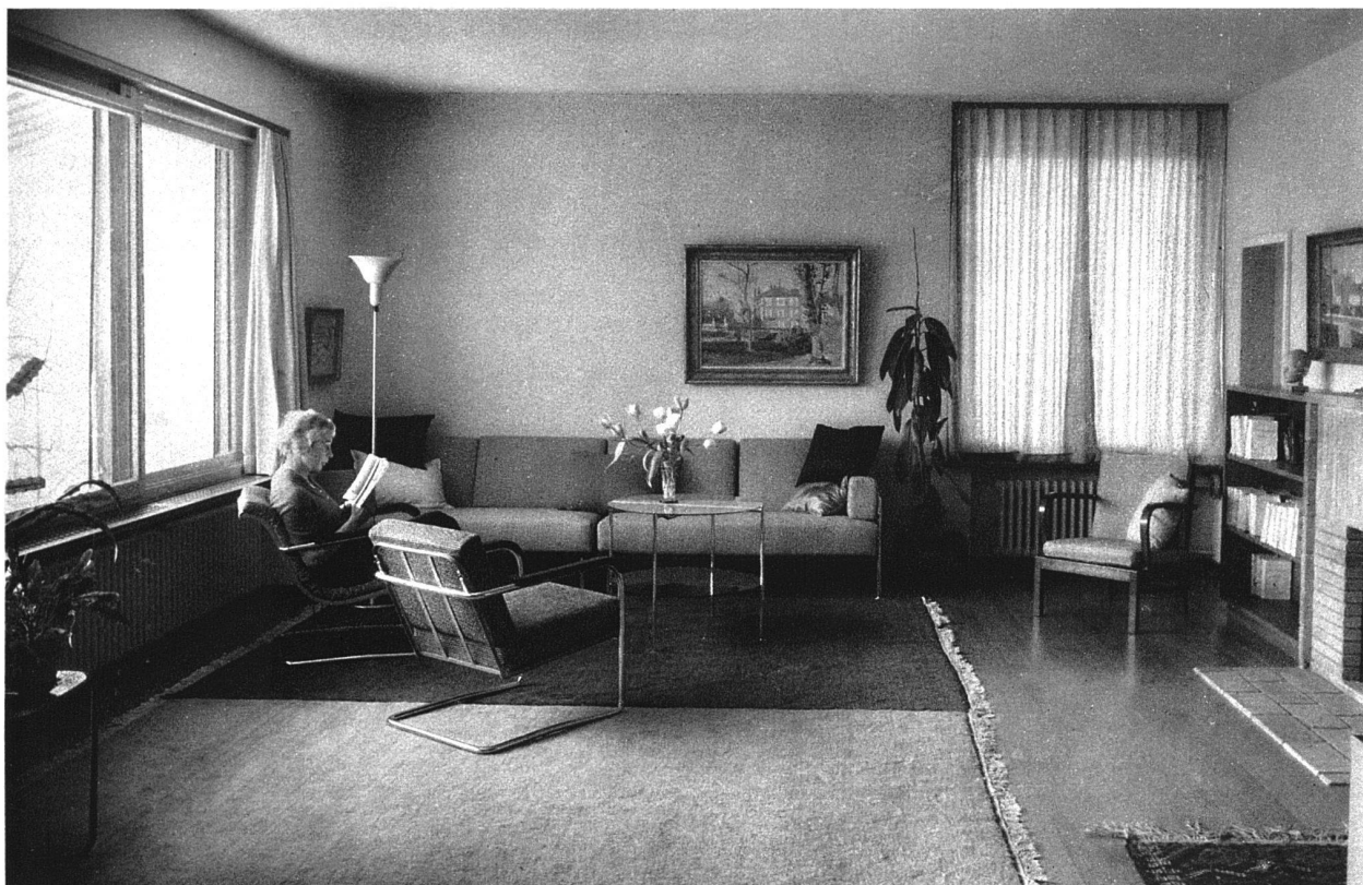
Wohnhaus an der Schlossbergstrasse in Zollikon (Zürich) Hans Leuzinger, Architekt BSA Zürich und Glarus

Westwand des Wohnzimmers Blick aus dem Esszimmer gegen Westen