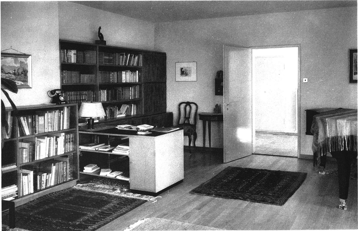
Nordostecke des Wohnzimmers