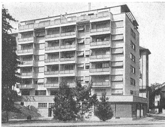
en haut: Immeubles Chemin de Roches, Genève M. Quétant, architecte en bas: Immeuble du quai des Arenières «Atelier d'Architectes»

Nous précisons également qu'en parlant d'une certaine carence des architectes du Palais, nous ne sortons pas du terrain esthétique et que les appréciations de