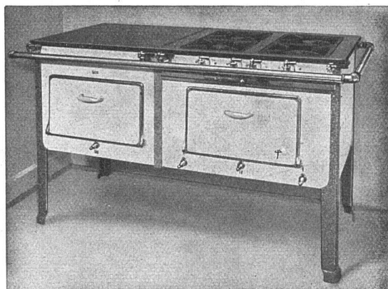
Fig. 3 Gasherd mit seitlich angebautem Brat- und Backofen

leicht zerlegbar. So können die Herdbestandteile wie Geschirr abgewaschen werden. Die Brenner sind rückschlagsicher und derart gestaltet, dass die Verbrennung vollkommen, mit hohem Wirkungsgrad, erfolgt. Durch weitgehende Kleinstellbarkeit der Flammen wird sehr sparsames Kochen erzielt. Die Herdplatten oder Einsatzringe haben hohe Rippen, was für die vollkommene Verbrennung des Gases erforderlich ist. Die Backofenhähne sind besonders