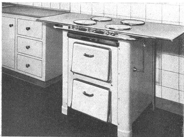
Fig. 1 Gasherd in normaler Ausführung