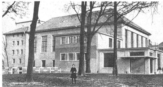
Der neue Fest- und Theatersaal der Kursaal Schänzli A.-G. Bern. Mitte November ist der Neubau eröffnet worden. Westseite. Architekt: Albert Gerster.

Der «Escalier Daru» ist vollkommen erneuert worden: die kleinliche Ornamentierung ist beseitigt, die Sammlung von Gipsabgüssen weggeräumt, so dass der ganze Raum nunmehr ohne Misston durch die grandiose Nike von Samothrake beherrscht wird. Auch die angrenzenden italienischen Säle sind erneuert, die Botticelli-Fresken aus der Villa Lemmi sind von der finsternen Treppenhauswand in den hellen Saal der italienischen Primitiven versetzt worden, sie wie auch die Fragmente der Luini-Fresken sind in die Wand eingelassen, so dass sie nunmehr wandbildmässig wirken, wie sie gemeint sind, und nicht als Tafelbilder.