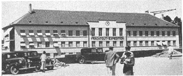
Der neue Güterbahnhof Weiermannshaus SBB